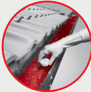
Roof Gutters Alur Bumbung Rumah

Get updates on Dengue clusters: @nea.gov.sg/dengue