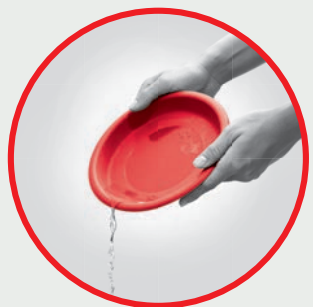
Flower Pots/Plates Pasu/Pengalas Pokok Bunga