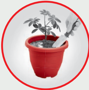
Hardened Soil Tanah Yang Keras