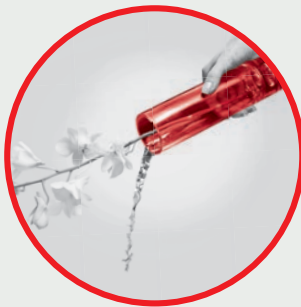
Flower Vases/Bowls Pasu/Balang Bunga Hiasan