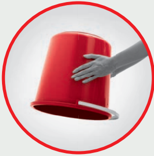
Pails Bekas Penyimpan Air

Periksa kawasan rumah anda secara kerap untuk mengesan pembiakan nyamuk. Di sini terdapat beberapa tempat pembiakan.